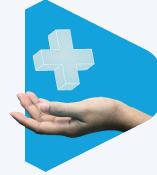
SISTEMAS DE SALUD